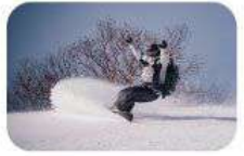
バックカントリー